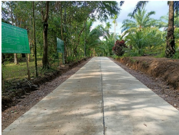
ภาพหลังดำเนินการ