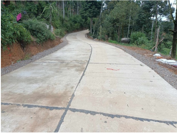
ภาพหลังดำเนินการ