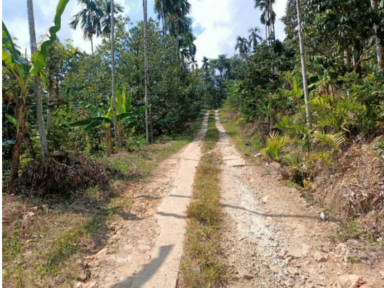
- ภาพก่อนดำเนินการ -