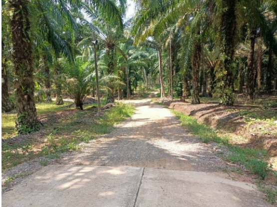
- ภาพก่อนดำเนินการ -