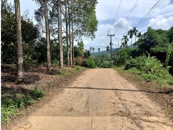
- ภาพก่อนดำเนินการ -