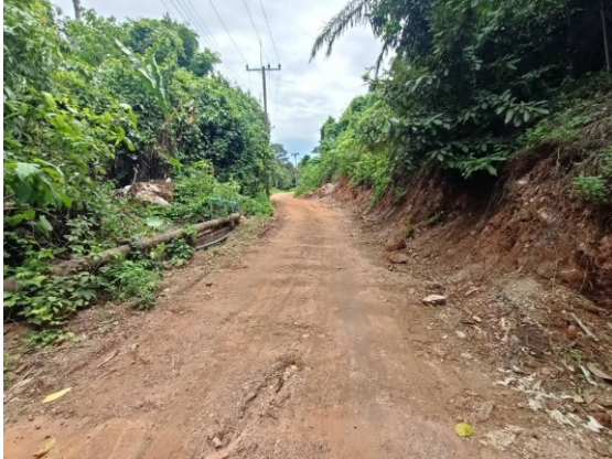
- ภาพก่อนดำเนินการ -