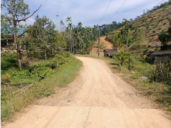
- ภาพก่อนดำเนินการ -