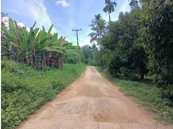
- ภาพก่อนดำเนินการ -