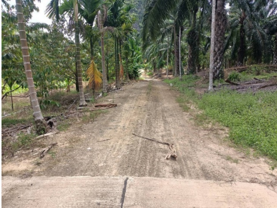
- ภาพก่อนดำเนินการ -