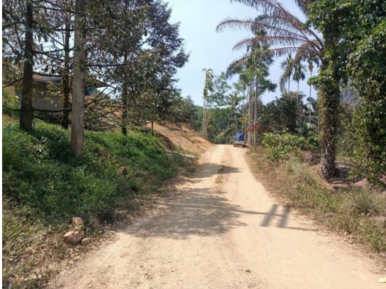
- ภาพก่อนดำเนินการ -