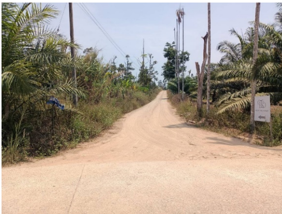
- ภาพก่อนดำเนินการ -