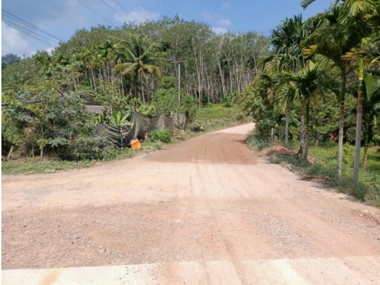
- ภาพก่อนดำเนินการ -