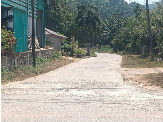
- ภาพก่อนดำเนินการ -